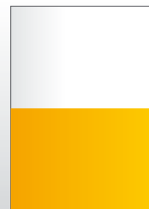
1/2 страница (216 x 151.5 мм)